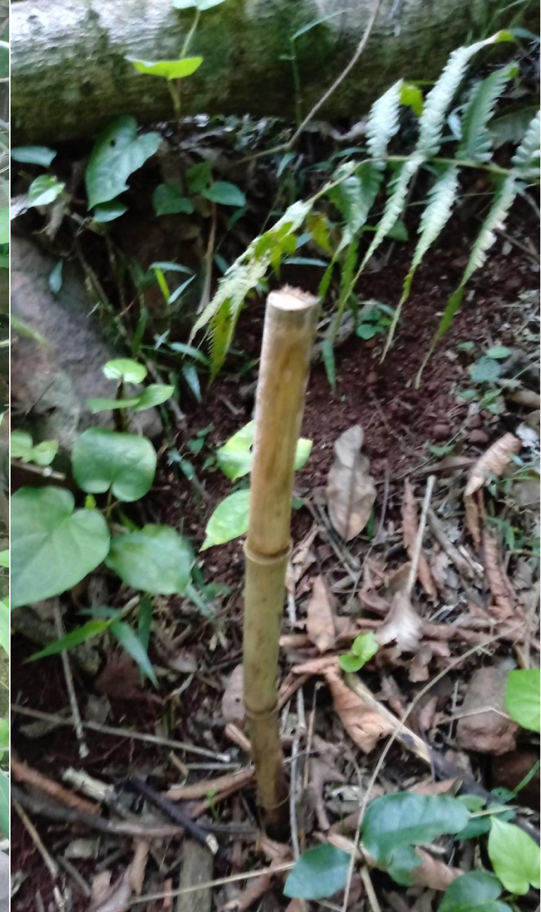
Bambu maciço – novembro 2019 Origem: Campos Novos/Vargem