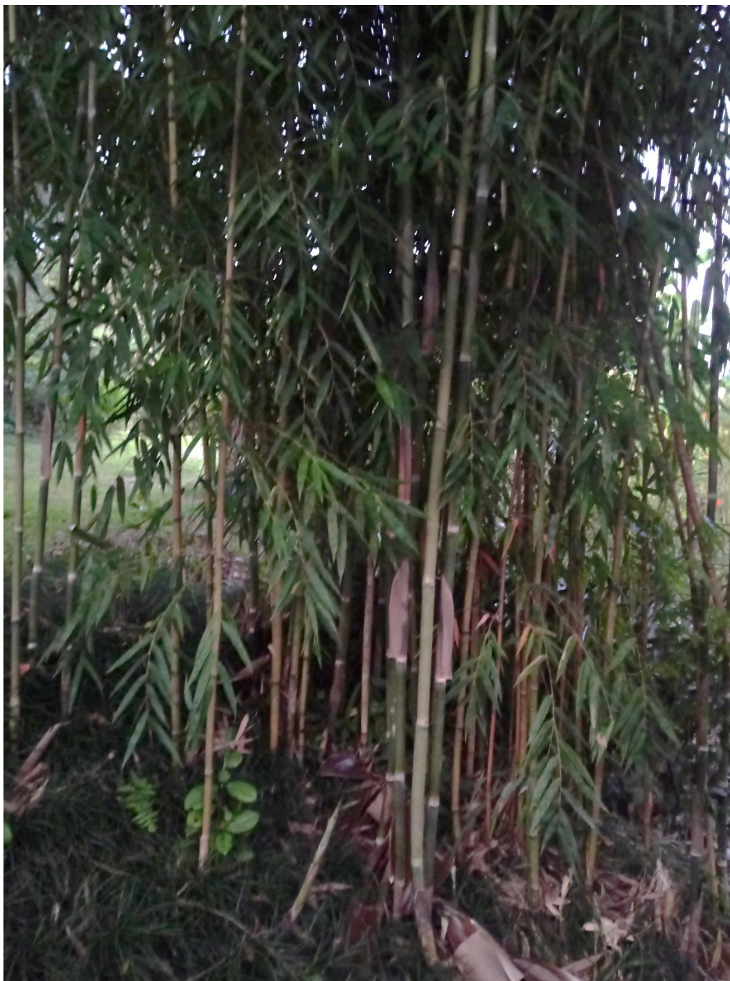
Merostachys skvortzovii Send.