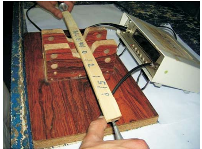
Figura 1. Ensaio das taliscas por ultra-som

Para a análise de eficiência do tratamento, realizaram-se vistorias após cada tempo de exposição, antes da retirada das taliscas dos ambientes de exposição; em seguida, elas foram destinadas aos ensaios laboratoriais (não destrutivo, por ultrassom e destrutivo, por flexão estática); inicialmente, antes de serem submetidas aos dois tipos de exposição se aplicou, às taliscas secadas ao ar, o END, para a determinação da velocidade do pulso ultra-sônico (VPU) na direção longitudinal (paralela às fibras do bambu). Considerou-se que o tratamento em si não modificava as características físicas e mecânicas das taliscas (Hidalgo-López, 2003), conforme também relatado por Brazolin et al. (2004) para produtos preservativos utilizados para madeiras. A VPU foi calculada por meio da medição do tempo de propagação, conhecendo-se o comprimento das peças. Obteve-se o tempo de propagação (em \mu s) com o auxílio do equipamento de ultra-som Steinkamp BP-7, dispondo de transdutores de seção exponencial de 45 kHz de frequência de ressonância. Para a obtenção da VPU os sensores eletroacústicos foram posicionados na porção mediana, em relação à espessura (altura) e à largura de cada talisca (Figura 1).